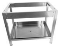
Gulvstativ rustfritt IWD-H/E