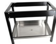
Gulvstativ lakkert IWD-H/E